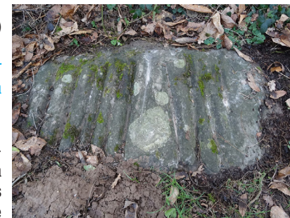
Le polissoir de la Roche Grenolée

6 S'engager à droite sur le sentier des Courtils-de-la-Ville. Prendre la Grand-Rue à gauche.